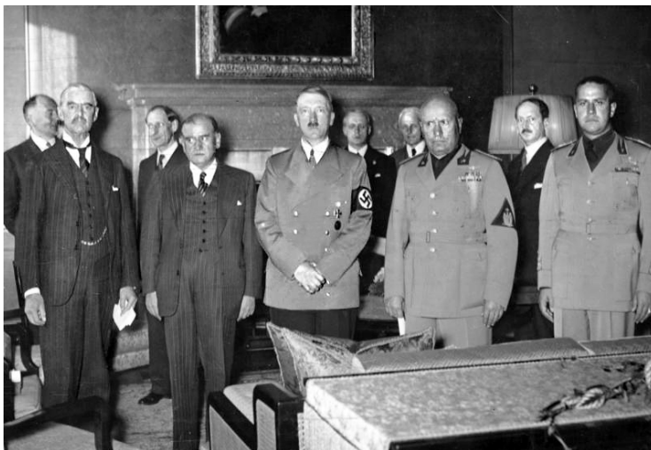
Fotografie z mnichovských jednání.