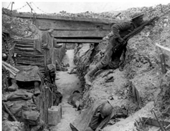
Bitva na Sommě